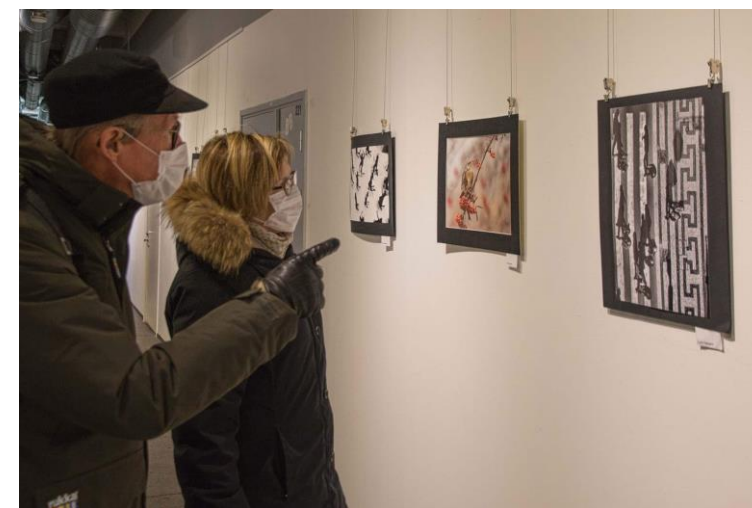
Galeria West | Helsínquia | Finlândia