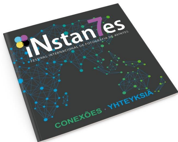
Capa do catálogo

Conexões | Yhteyksiä é um trabalho que reúne 12 fotógrafos portugueses e 13 finlandeses que exploram o tema, debruçando-se sobre os seus espaços de significância próprios.